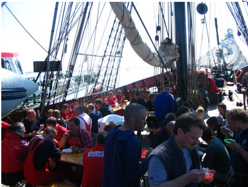
Gemeinsames Mittagessen der Seenotretter vom Kreuzer Berlin und den Booten Karl van Well, Asmus Bremer und Bottsand mit der Crew der Brigg Roald Amundsen. Zum Glück ist parallel Smutausbildung