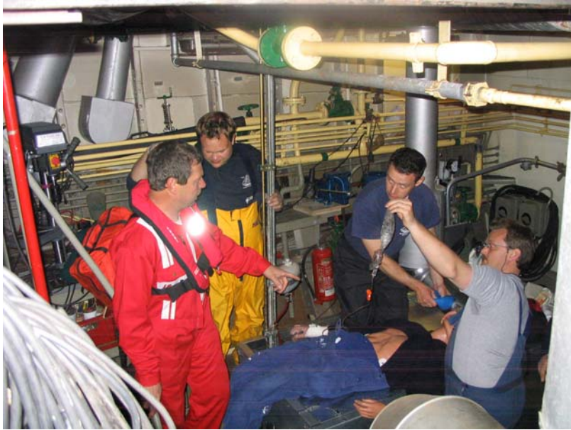
Reanimieren, mehr als eine Stunde