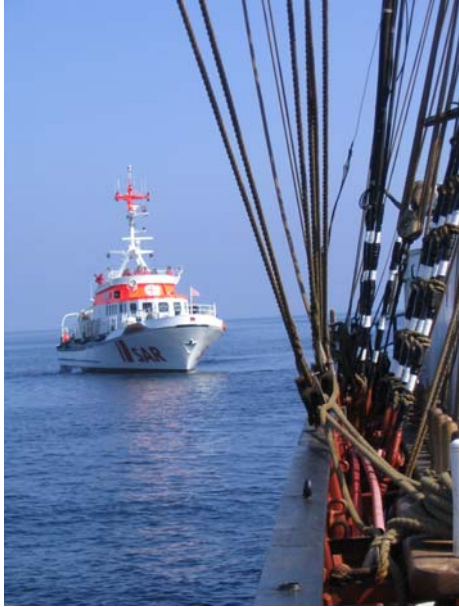
Der Kreuzer Berlin als On-Scene-Coordinator