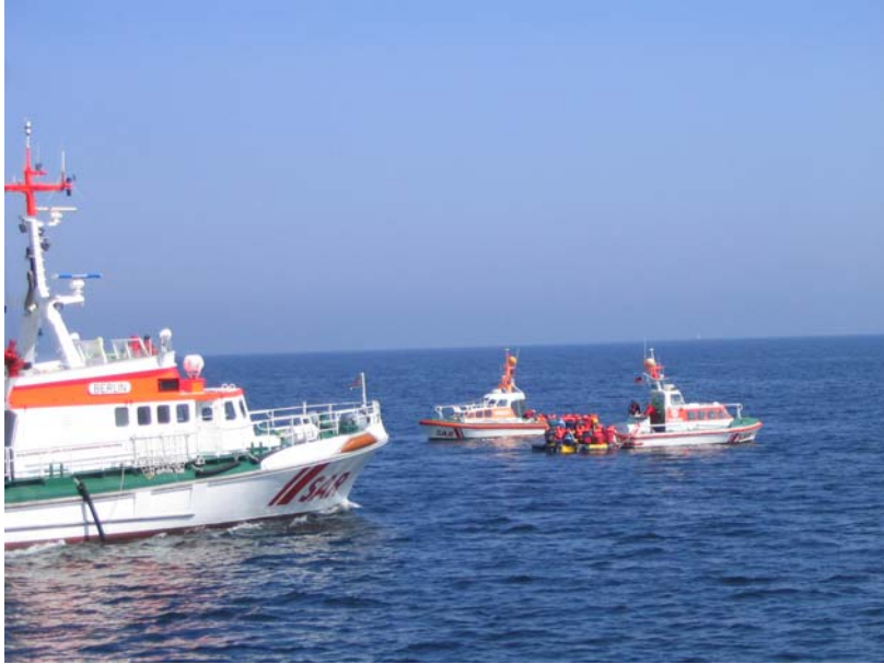
Ab ins Trockene