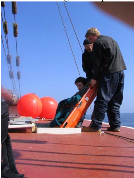
Nur auf diesem Weg gehts hier raus