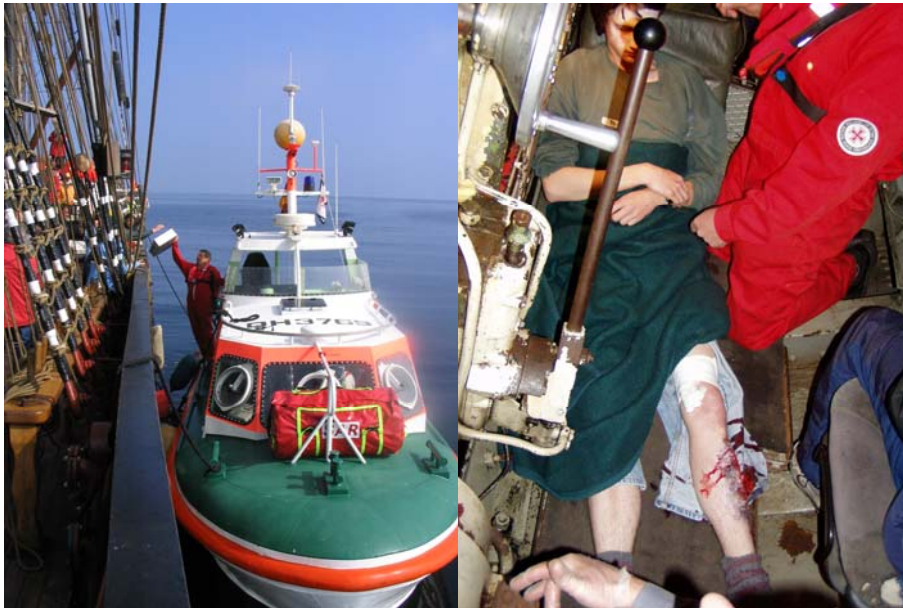
Der erste Retter trifft ein und findet einen von 3 Verletzten mit offenem Schienbeinbruch vor