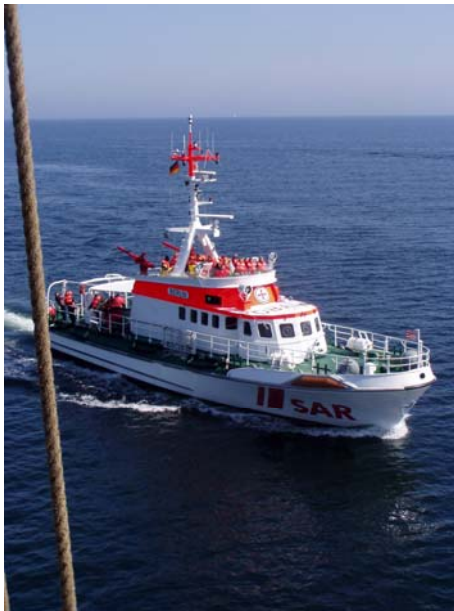
Der Kreuzer Berlin, geentert von der Roald Crew