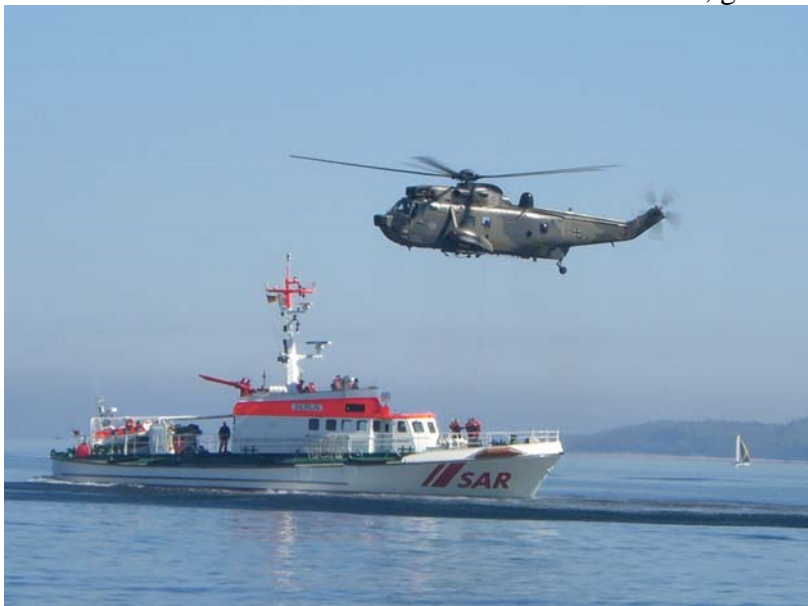
Pausenprogramm zu Mittag