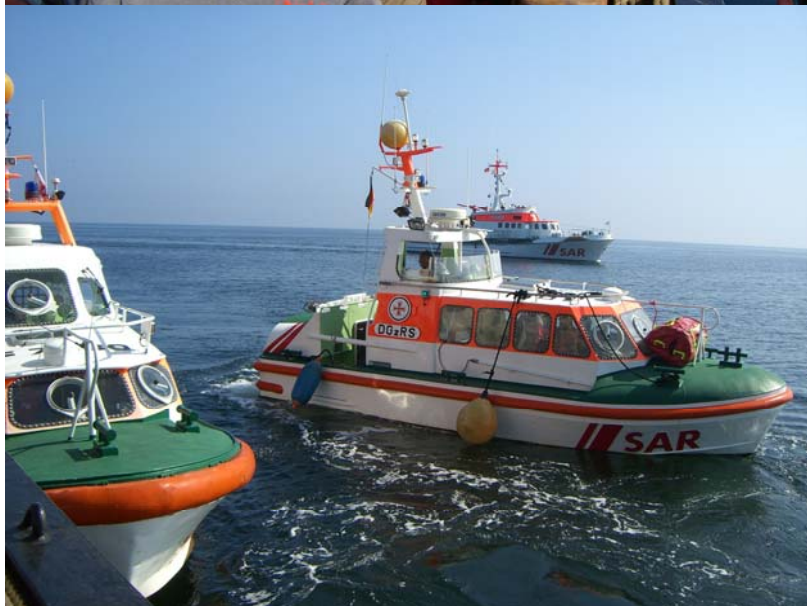
Verletzte werden per Hand und Ladebaum übergeben und zum Kreuzer gebracht