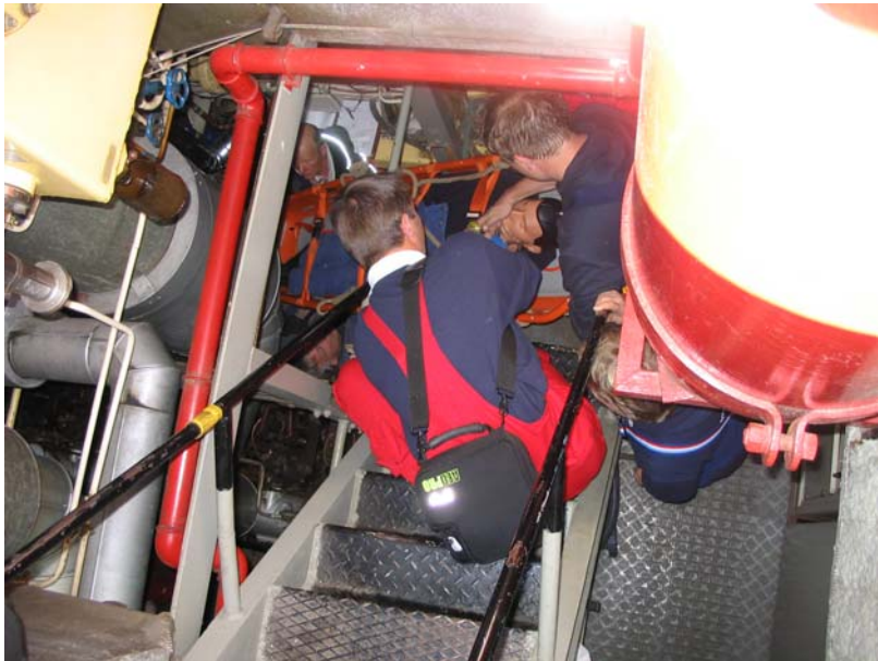
Für den schwierigen Transport aus dem MRaum werden viele Hände benötigt