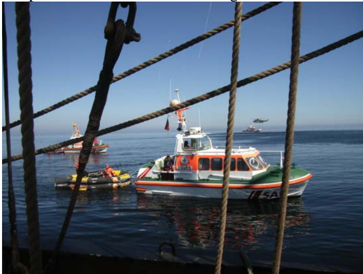
Richtig was los !