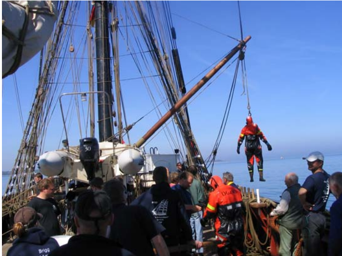
Ausprobieren der Kälteschutzanzüge