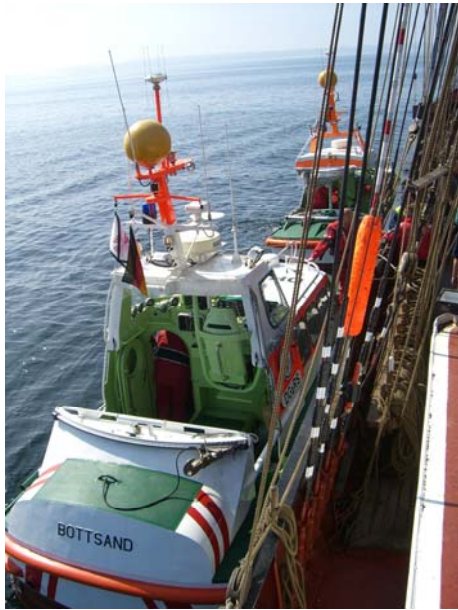
Weitere Boote treffen ein