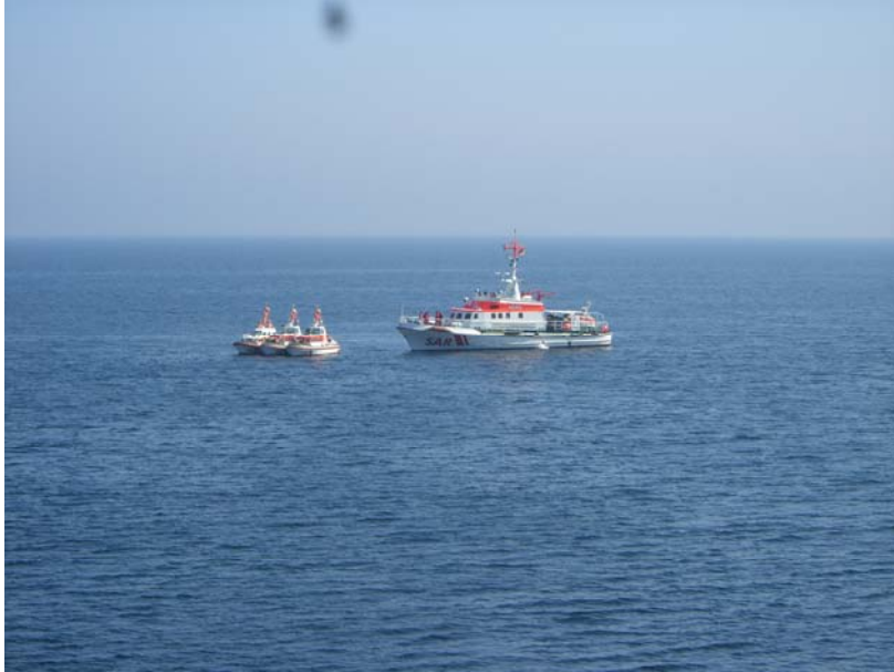
Pause nach Übung 1