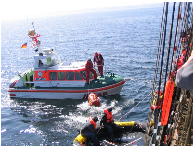
Reversible Liferrafts zur Evakuierung