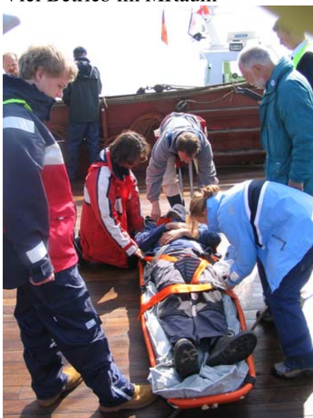
Der erste Verletzte ist an Deck