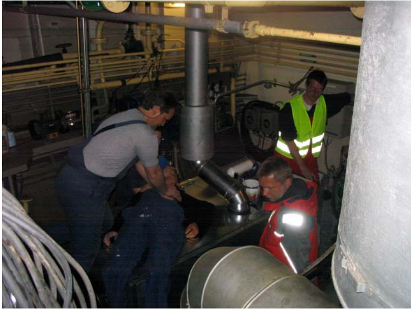
Notfall im MRaum, es wird bereits renaimiert