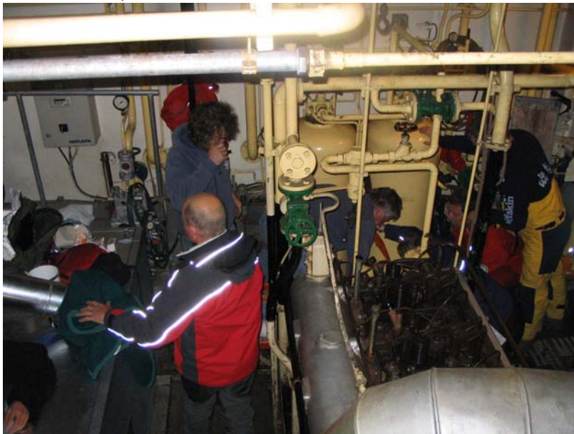
Viel Betrieb im MRaum